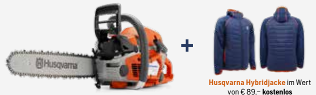
Husqvarna Hybridjackete im Wert von € 89,- kostenlos

50.1 cm 3 , 3.0 kW, Schwertlänge 33–50 cm, 5.3 kg, AutoTune™, Air Injection™, X-Torc und Low Vib