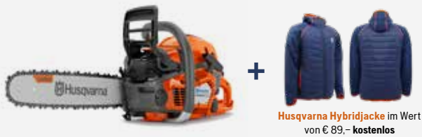
Husqvarna Hybridjackete im Wert von € 89,- kostenlos

50.1 cm 3 , 2.7 kW, Schwertlänge 33–50 cm, 5.3 kg, AutoTune™, Air Injection™, X-Torc und Low Vib