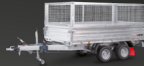
RK 2600/15 T