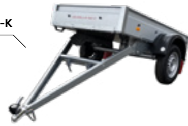
LPA 206 U-B-300-K