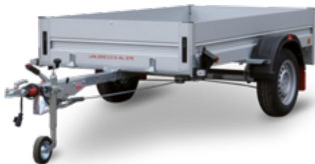
LPA 250/13 G-AL-STK