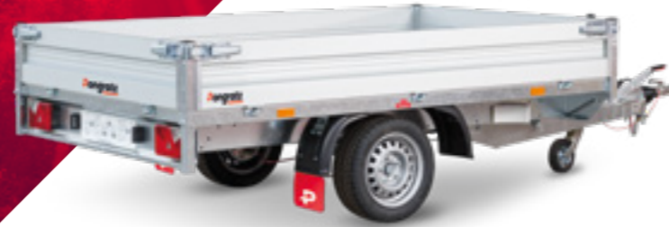
PHL 3700/17 T-AL