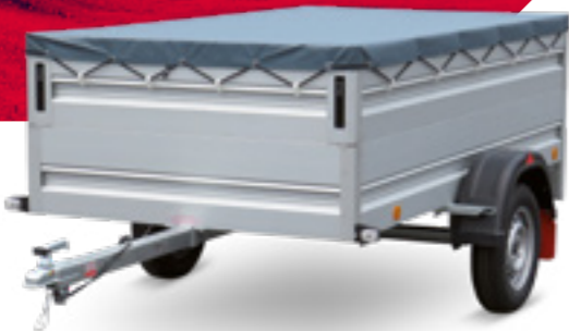
LPA 250/13 U-AL