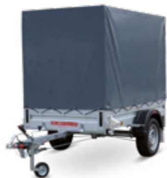
LPA 230/12 G-AL STK