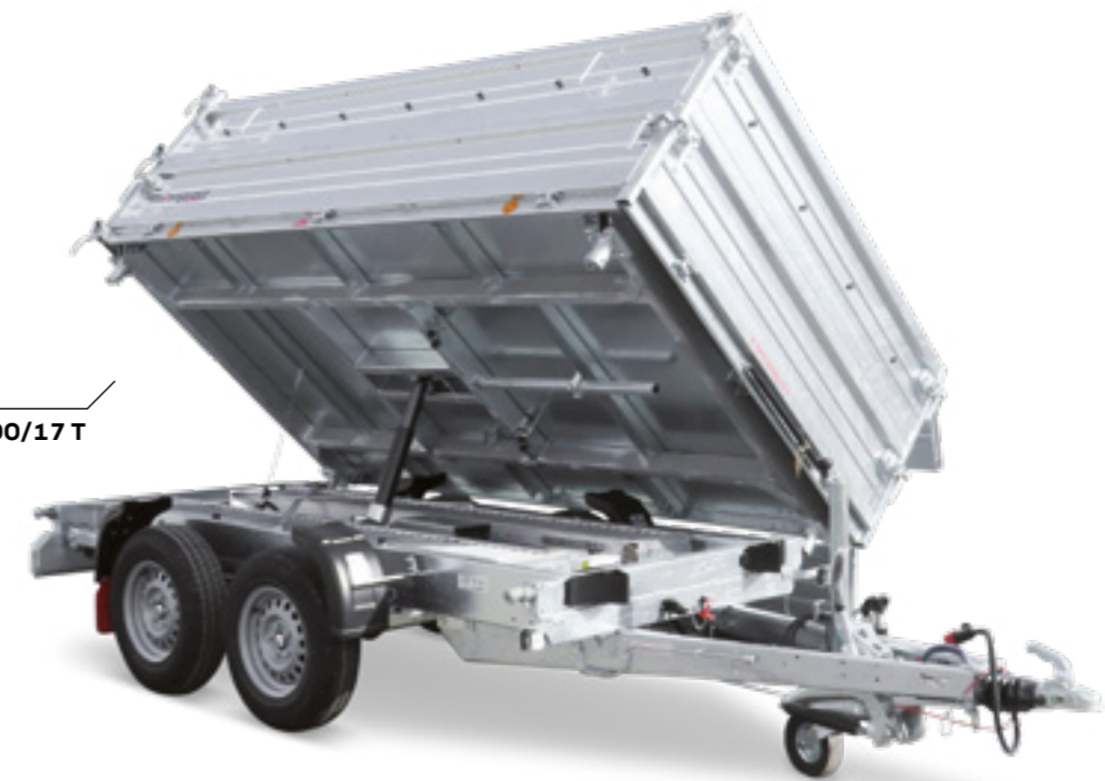
3-SKS 3100/17 T