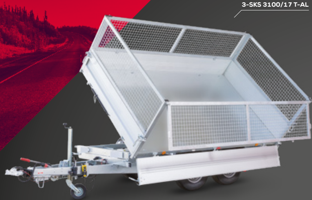
3-SKS 3100/17 T-AL