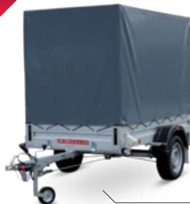
LPA 230/12 G-AL-STK