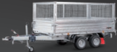
RK 2600/15 T