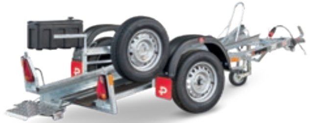
MA 250 U-K