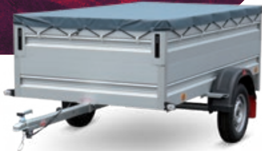
LPA 250/13 U-AL