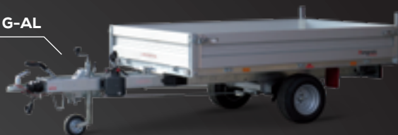
L-RK 2315 G-AL