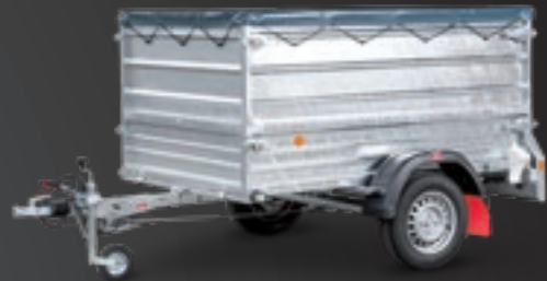
EPA 206/12 G-STK