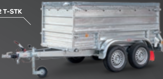
EPA 250/12 T-STK