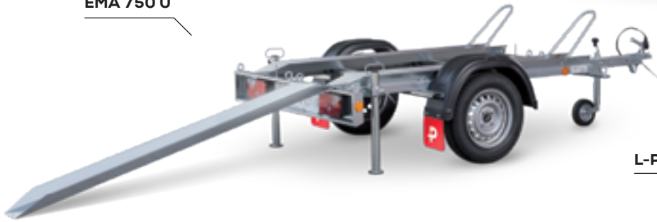
EMA 750 U