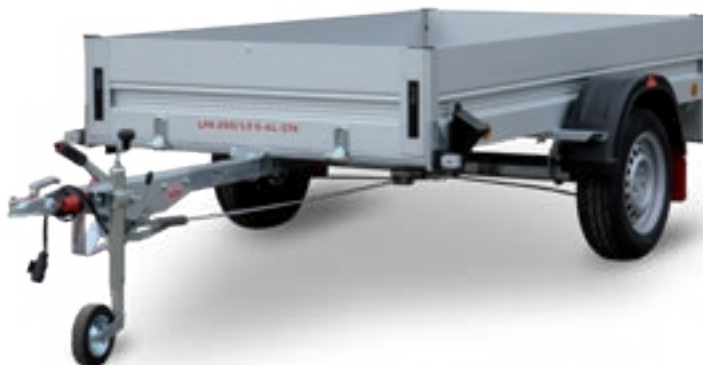
LPA 250/13 G-AL-STK