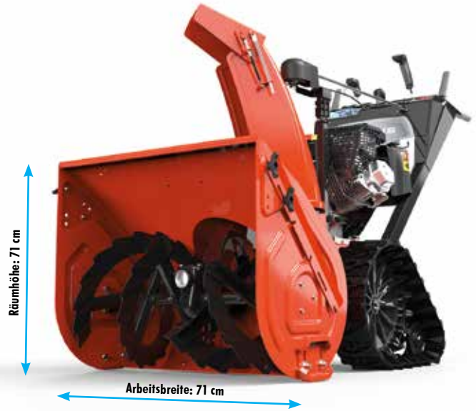
Ariens ST 28 DLET Hydro Pro EFI Rapid Track