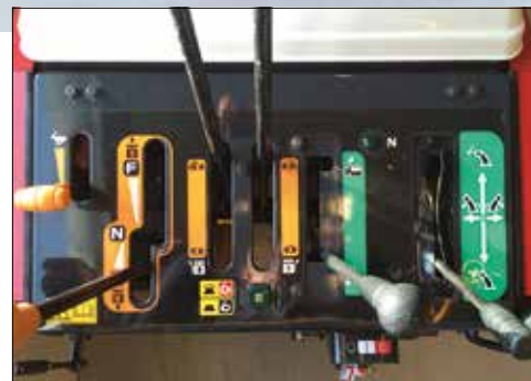
Übersichtlich gestaltetes Bedienpanel