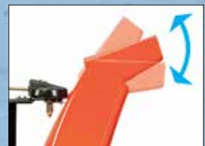
Wurfweitenverstellung vom Holm für noch mehr Komfort

Die Professional Modelle erfüllen die hohen Anforderungen von Profis. Der extrem laufruhige und kraftvolle 420 cm 3 B&S Motor liefert ausreichend Power um ein perfektes Räumergebnis zu liefern. Weitere Komfortmerkmale wie Elektrostart, Arbeitsscheinwerfer, Griffheizung, seitliche Schneidmesser, automatische Differentialsperre sowie eine große Bereifung garantieren beste Arbeitsbedingungen.