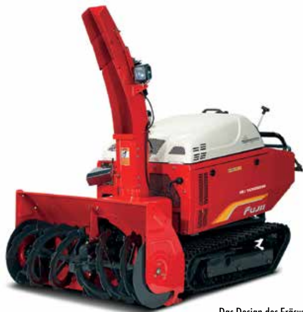
Das Design des Fräswerks ist für einen harten Einsatz in nassem und gefrorenem Schnee ausgelegt.