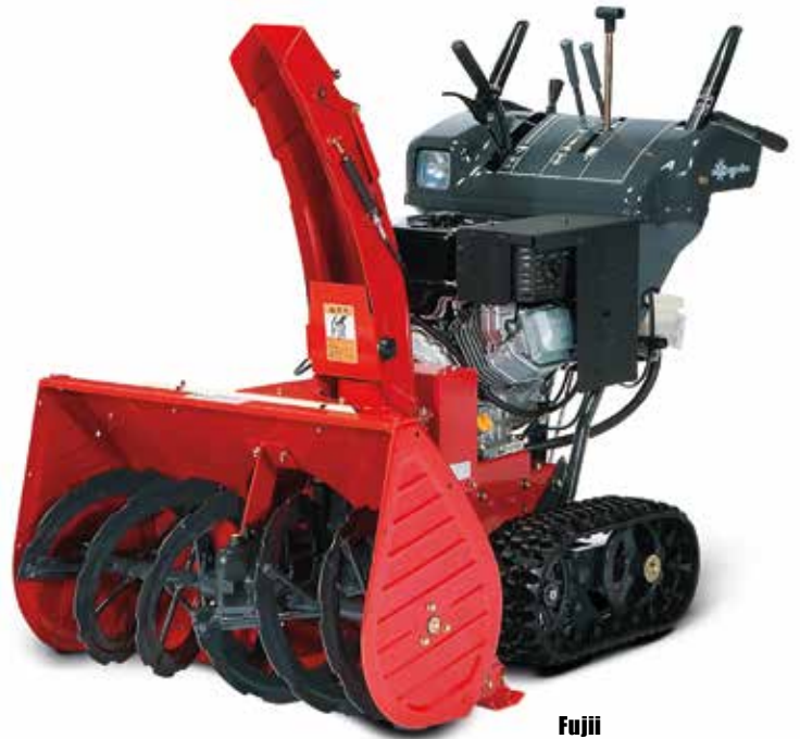
Fujii SK 810 MX

Der japanische Hersteller Fujii ist bekannt für Top-Qualität und extrem leistungsfähige Schneefräsen. Die besonders leistungs- und drehmomentstarken Motoren sorgen für ausreichend Kraft bei schwierigsten Bedingungen. Durch die spezielle Gestaltung des Wurfkamins erzielen sie Wurfleistungen von bis zu 25 m, die auch bei hohen Schneemengen und nassem Schnee mühelos erreicht werden.