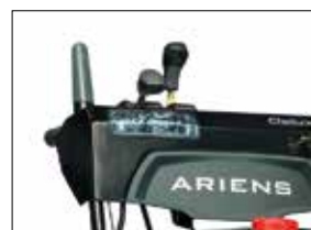
Halogenscheinwerfer: Sicheres Arbeiten auch bei Dunkelheit