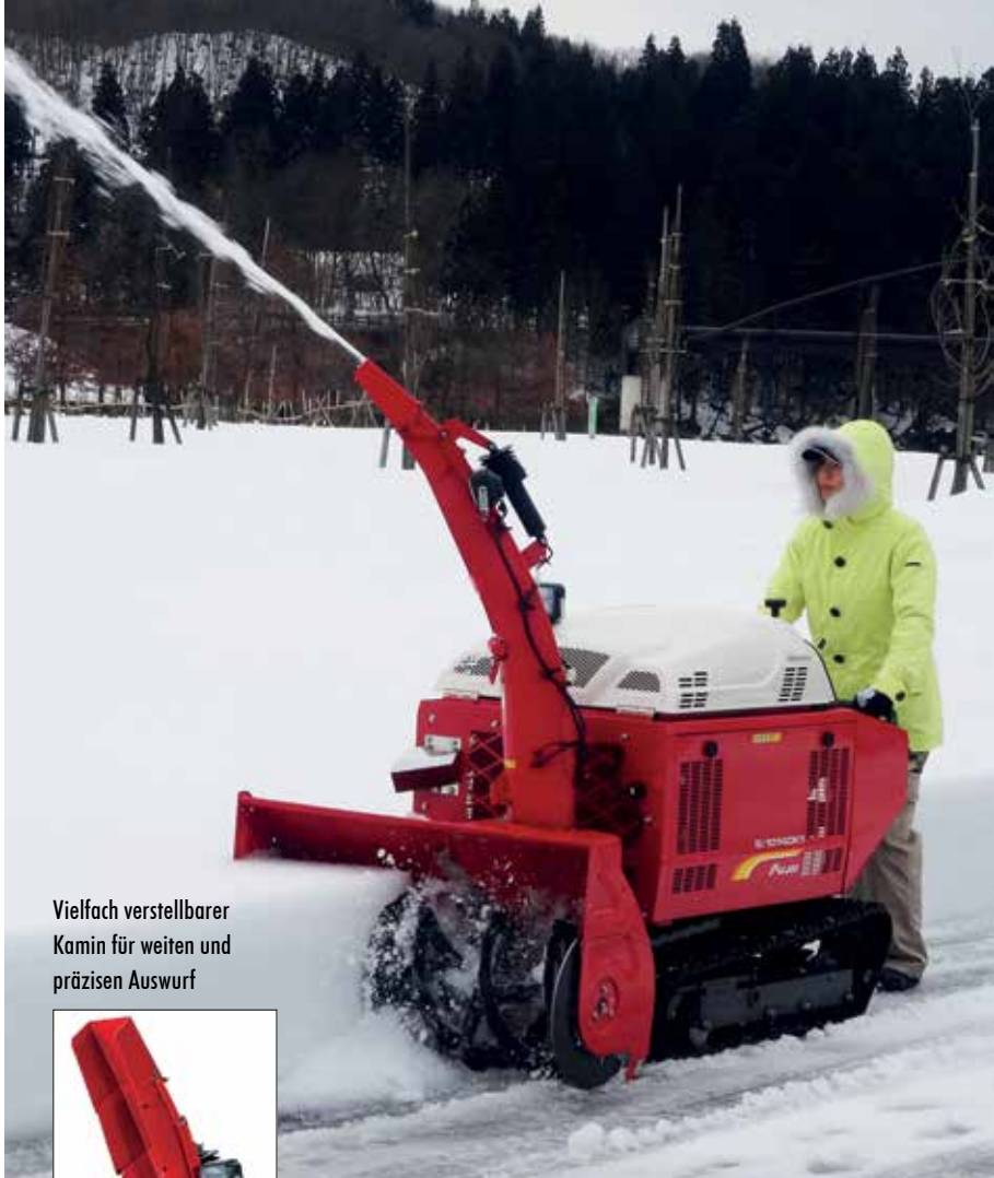
Vielfach verstellbarer Kamin für weiten und präzisen Auswurf

Die Fujii Modelle der Profiklasse überzeugen gleichermaßen durch Leistung und Ausstattung. Sie erlauben müheloses Arbeiten unter härtesten Bedingungen. Dazu glänzen sie durch hohen Komfort. Je nach Ausführung heben die Fräsen der Profiklasse selbsttätig das Fräsgehäuse beim Retourfahren und halten den Fräskopf automatisch waagrecht.