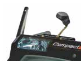
Halogenscheinwerfer: Sicheres Arbeiten auch bei Dunkelheit