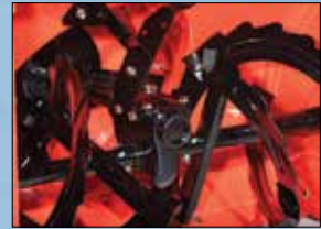
Frostresistentes Hochgeschwindigkeitsschleuderrad mit 36,5 cm Durchmesser