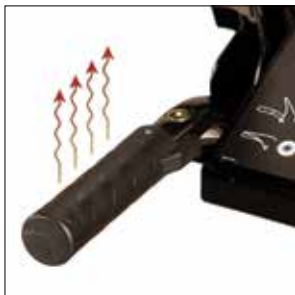
Nachrüstset Griffheizung (für Deluxe Modelle)