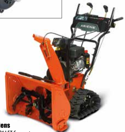
Ariens ST 24 LET Compact