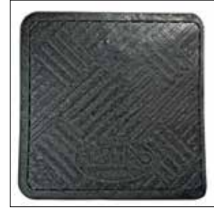
Gummimatte: hält den Garagenboden sauber