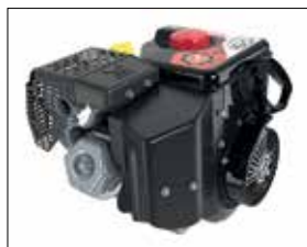
EFI Motor mit 369 cm 3