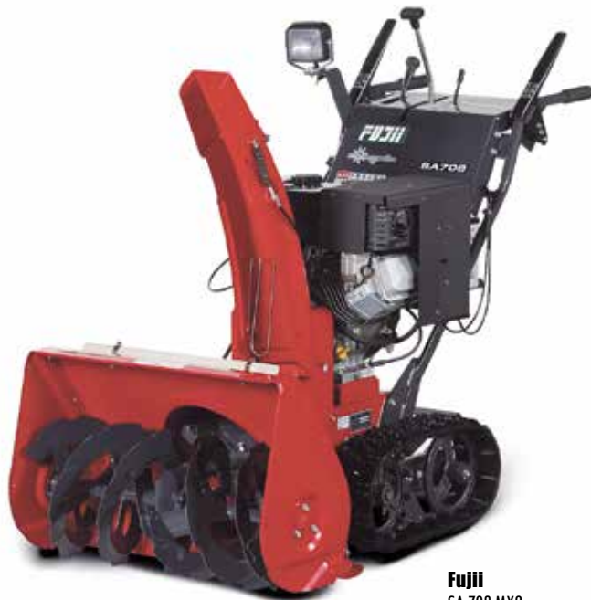
Fujii SA 708 MX2