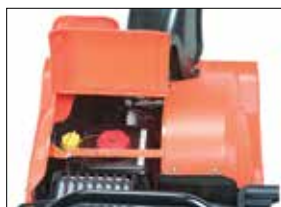
Wartungsfreundlicher Zugang zum Motor

Die einstufige Schneefräse PathPro ist die ideale Lösung für jene, die eine kompakte, leichte und leistungsfähige Schneefräse suchen.