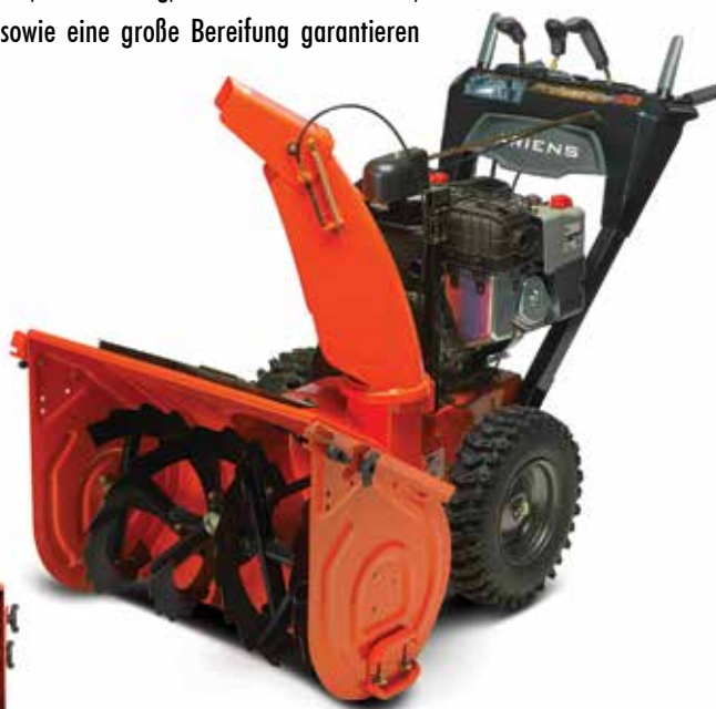
Ariens ST 28 DLE Professional