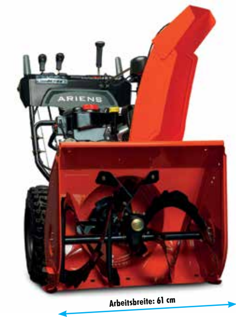
Ariens ST 24 DLE EFI Platinum