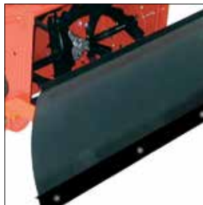
Universal Kunststoff-Schneeschild: Räumbreite 100 cm, passend für alle Ariens Fräsen sowie Sno-Tek ST 24