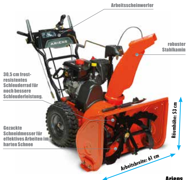
Ariens ST 24 DLE Deluxe

Alle Ariens Modelle präsentieren sich in dieser Saison mit ergonomischen Verbesserungen in einem neuen ansprechenden Design. Außerdem verfügen sie über das neue, wartungsfreundliche „Top-Load“ Getriebe aus Guss. Viele praktische Ausstattungsdetails sorgen je nach Modell für komfortable Handhabung und beste Räumleistung.