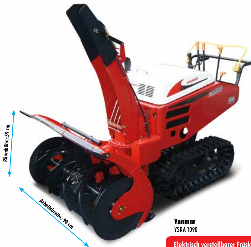
Yanmar YSRA 1090

Der 12V Elektrostart ist besonders praktisch. Mittels Zündschlüssel kann die Fräse überall bequem gestartet werden.