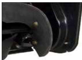
Seitenpaneele aus Stahl für besseres Arbeiten im kompakten Schnee