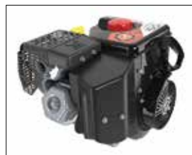
EFI Motor mit 369 cm 3