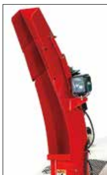
Vielfach verstellbarer Kamin für weiten und präzisen Auswurf

Die Schneefräsen von Fujii bieten höchsten Arbeitskomfort, Zuverlässigkeit und zeichnen sich durch besonders einfache Bedienung aus. Je nach Modell verfügen sie über eine automatische Hebefunktion des Fräskopfes beim Zurückfahren, eine automatische Neigungsanpassung oder auch eine automatische Geschwindigkeitskontrolle. Die gesamte Fujii-Palette verfügt serienmäßig über Lenkhilfe und elektrische Kaminverstellung.