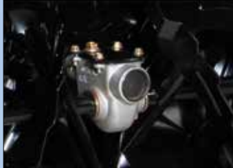
Top-Load Getriebe aus Aluminium

Die zweistufigen Schneefräsen von Sno-Tek sind die idealen Einstiegsgeräte mit unschlagbarem Preis-Leistungsverhältnis. Sie verfügen über das wartungsfreundliche „Top-Load“ Aluminiumgetriebe und liefern durch eine optimale Abstimmung zwischen Motor und Räumbreite ein stets sauberes Räumergebnis.