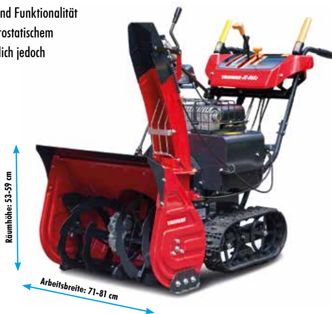
Yanmar JS 865 CS

Sie bieten Komfort und Funktionalität wie Modelle mit hydrostatischem Antrieb, liegen preislich jedoch wesentlich günstiger.