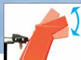
Wurfweitenverstellung vom Holm für noch mehr Komfort

Die Professional Modelle erfüllen die hohen Anforderungen von Profis. Der extrem laufruhige und kraftvolle 420 cm 3 B&S Motor liefert ausreichend Power um mit 71 bzw. 81 cm Arbeitsbreite ein perfektes Räumergebnis zu liefern. Weitere Komfortmerkmale wie Elektrostart, Arbeitsscheinwerfer, Griffheizung, seitliche Schneidmesser, automatische Differentialsperre sowie eine große Bereifung garantieren beste Arbeitsbedingungen.