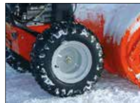
Automatische Differentialsperre für beste Traktion (DLE-Modelle)