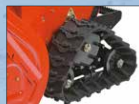
Richtungsgewundene Raupen für mehr Grip (ST 28 DLET)