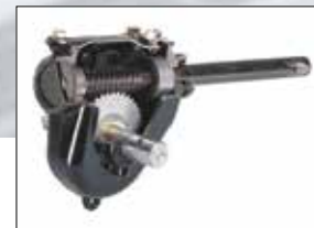
Top-Load Getriebe: aus Gusseisen mit synthetischem Getriebeöl