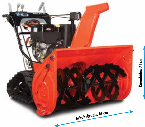
Ariens ST 28 DLET Hydro Pro