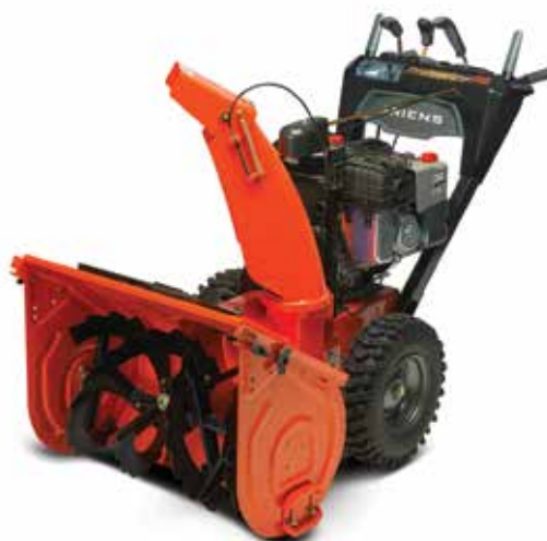
Ariens ST 28 DLE Professional

AutoTurn Quick Stick Kaminverstellung 2 parallel laufende Keilriemen Größerer Fräskasten Größere Frässchnecke Seitliche Schneidmesser Griffheizung