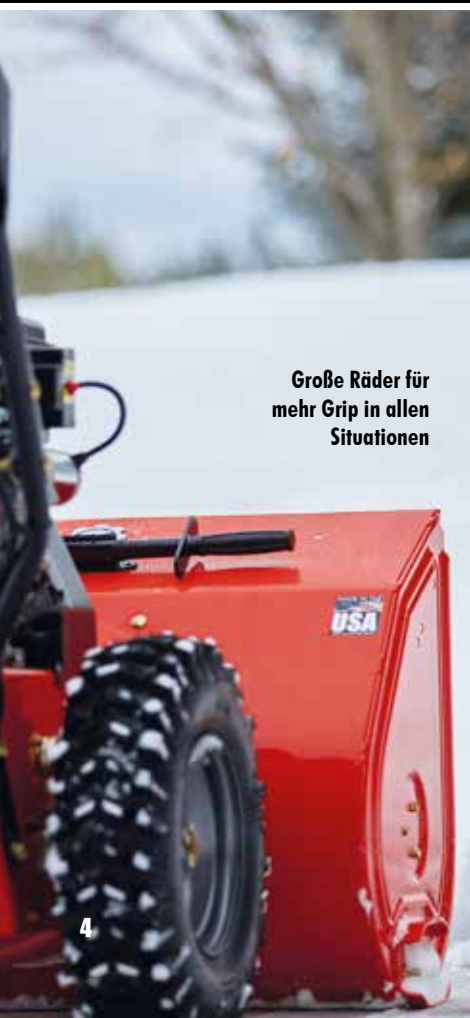
Große Räder für mehr Grip in allen Situationen

Top-Facts Auto Turn 2 parallel laufende Keilriemen Größeres Schleuderrad 230 V E-Start Licht