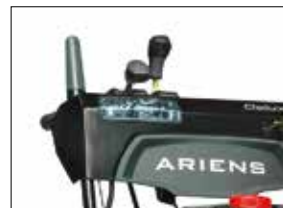
Halogenscheinwerfer: Sicheres Arbeiten auch bei Dunkelheit