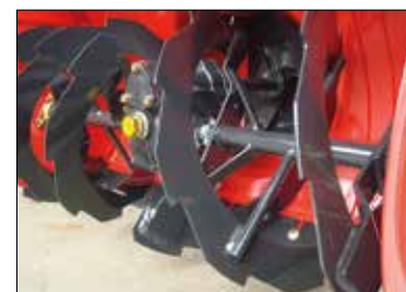
Das Design des Fräskopfes ermöglicht auch bei Schneematsch oder gefrorenem Schnee eine hohe Arbeitsgeschwindigkeit.