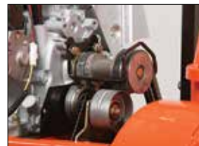
Zwei Keilriemen am Fräsantrieb für mehr Kraft und weniger Verschleiß

Top-Facts Auto Turn 2 parallel laufende Keilriemen Größeres Schleuderrad 230 V E-Start Licht