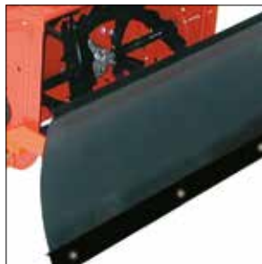
Universal Kunststoff-Schneeschild: Räumbreite 100 cm, passend für alle Ariens Fräsen sowie Sno-Tek ST 24