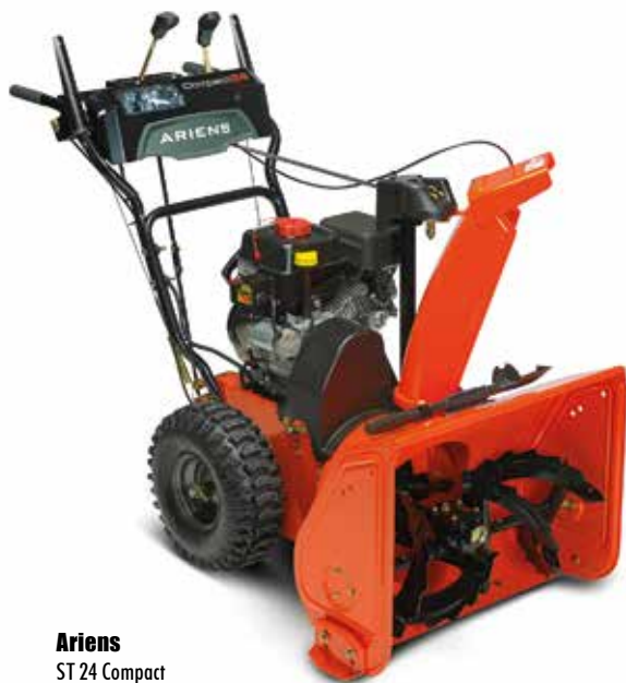
Ariens ST 24 Compact