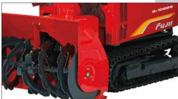
Das Design des Fräswerks ist für einen harten Einsatz in nassem und gefrorenem Schnee ausgelegt.