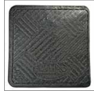
Gummimatte: hält den Garagenboden sauber