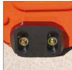
Kunststoffgleitschuhe: schonen empfindlichen Untergrund beim Arbeiten