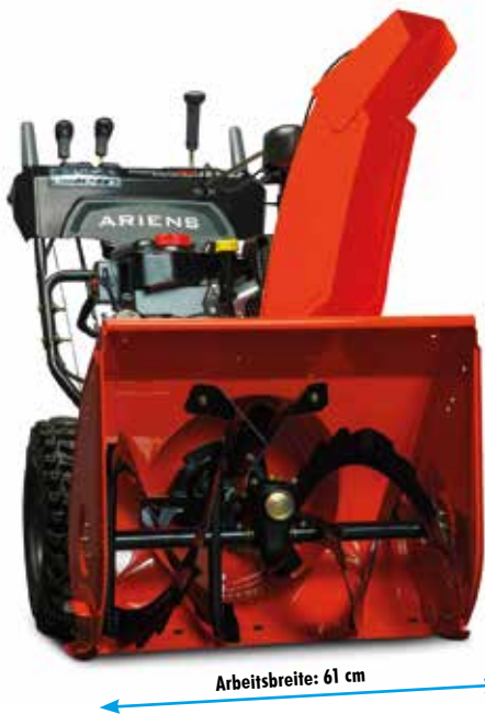
Ariens ST 24 DLE EFI Platinum

Beim Komfort punktet das Platinum Modell mit serienmäßiger Griffheizung, Kaminschnellverstellung sowie dem bewährten Auto-Turn Getriebe für müheloses Wenden.