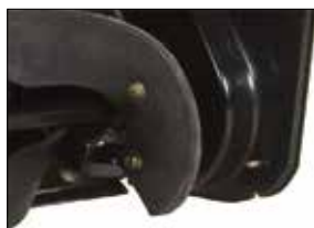
Seitenpaneele aus Stahl für besseres Arbeiten im kompakten Schnee