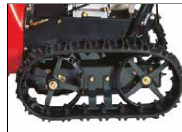
Die Führungsräder der Raupen sind aus robustem Gusseisen gefertigt. Sie garantieren eine spursichere Vorwärtsbewegung auch bei geneigtem Gelände.