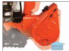
Einfache 5-fach-Höhenverstellung bei den Raupenmodellen