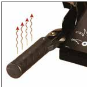
Nachrüstset Griffheizung (für Deluxe Modelle)